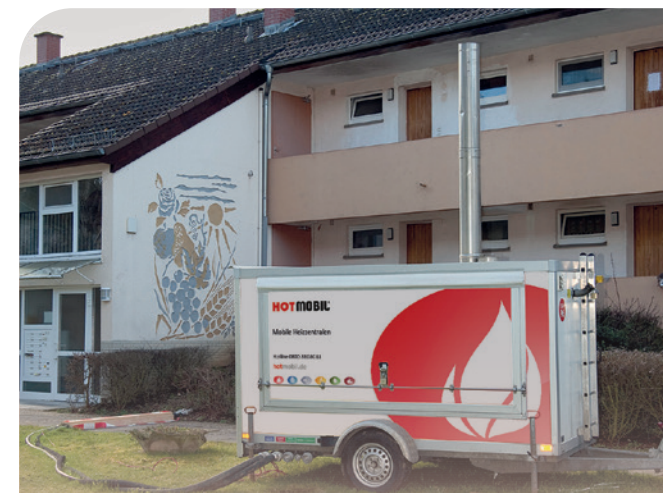
Beispiel einer förderfähigen Heizzentrale